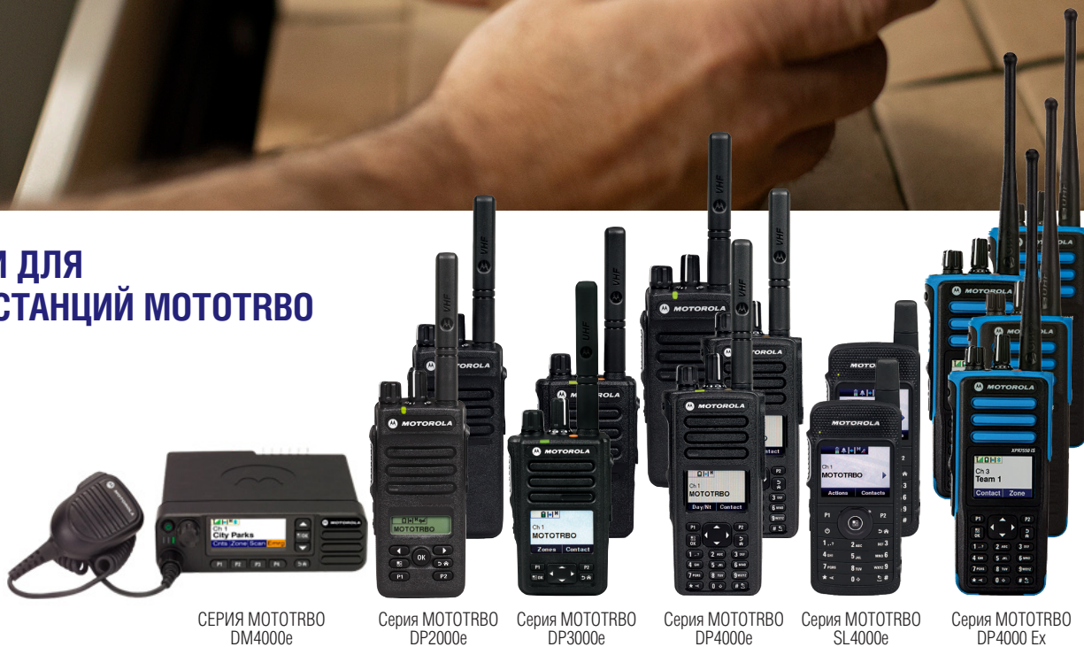
СЕРИЯ MOTOTRBO DM4000e